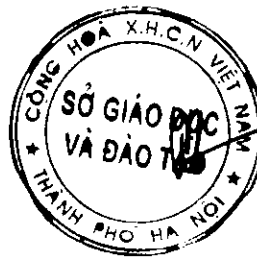
Chử Xuân Dũng